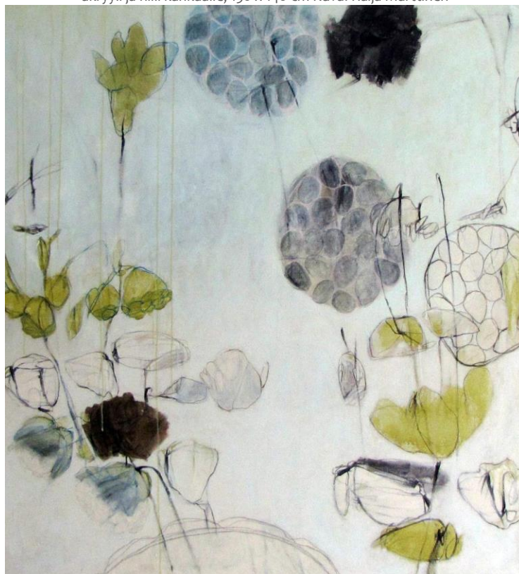
Raija Marttinen: sarjasta Ensimmäinen hellepäivä, 2014, akryyli ja hiili kankaalle, 150 x 140 cm

Raija Marttinen & Tiina Hölli [Artist's Book]